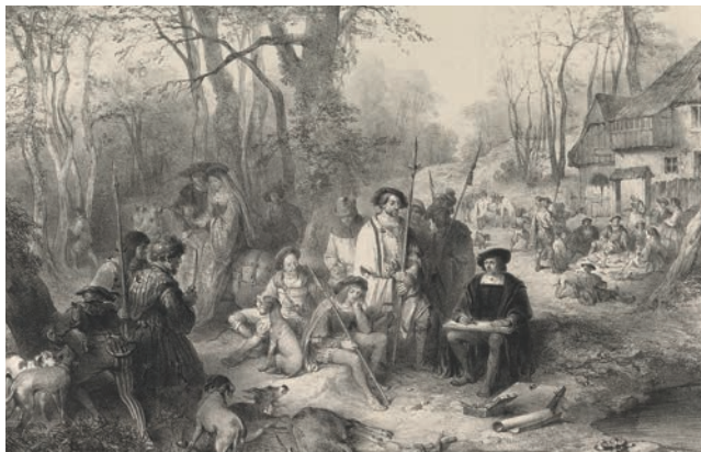
Bernard van Orley accompagnant Charles Quint à la chasse par J.-B. Madou, 1842 Bernard van Orley vergezelt keizer Karel op de jacht door J.-B. Madou, 1842

Enfin, le thème final reconsidère les grands principes de la peinture de Bernard van Orley au travers de l'influence du peintre et frère convers, Hugo van der Goes, ancien habitant bien connu du monastère de Rouge-Cloître.