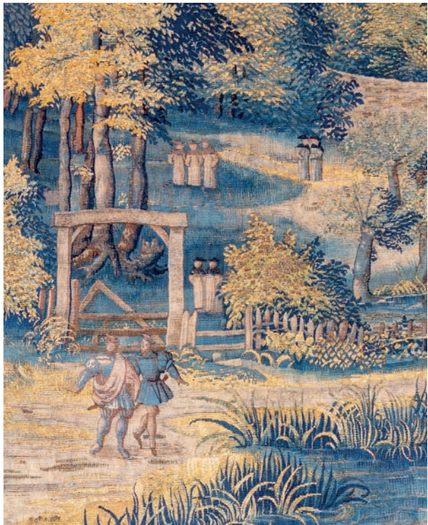
© Damien Defraene - Musée du Louvre

Cette exposition gratuite est réalisée avec le soutien de Bruxelles Urbanisme et Patrimoine (Direction Patrimoine culturelle), anciennement Direction des Monuments et des Sites.