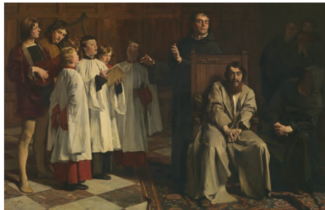
La folie d'Hugo van der Goes par E. Wauters, 1872 De waanzin van Hugo van der Goes door E. Wauters, 1872